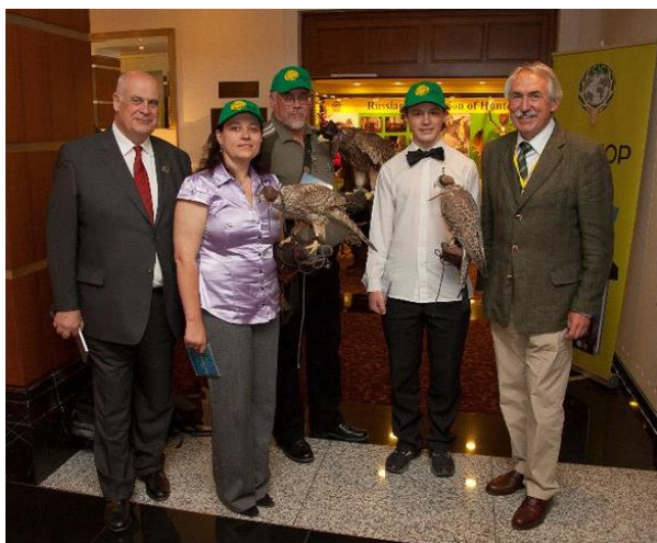
фото 2. Бернард Лозе (Президент CIC, Бельгия), члены «Союза сокольников Северо-Запада» с ловчими птицами, Карл-Хейнц Герсманн (Президент Deutscher Falkner Orden)